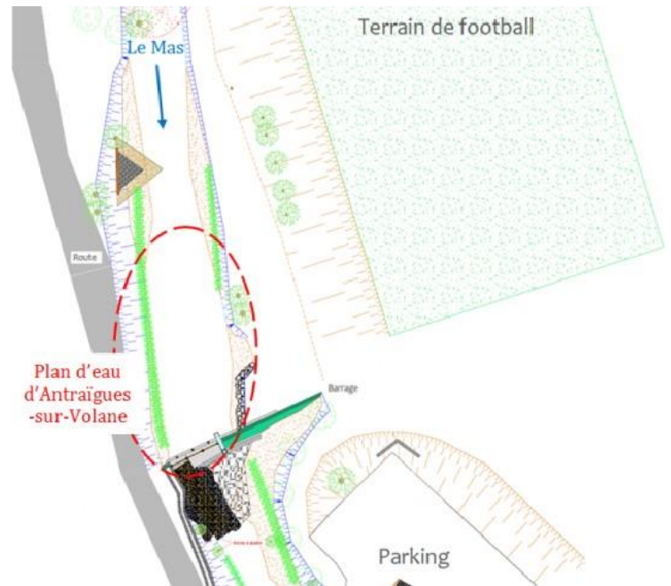
Schéma de la zone de baignade :

1 jour de fermeture de la baignade par temps de pluie