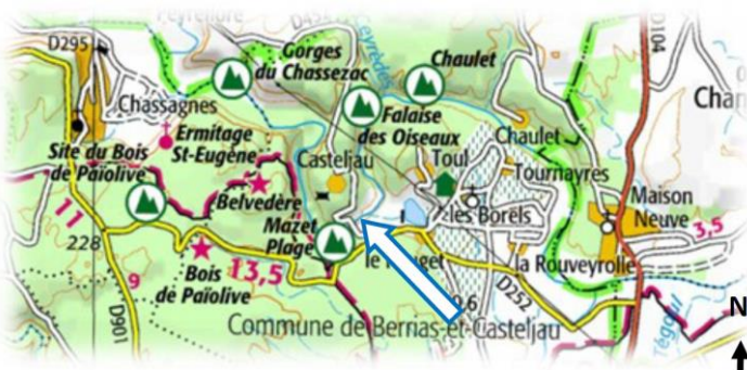
Carte IGN