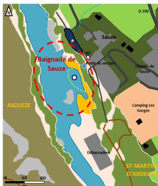
Schéma de la zone de baignade :

Épisodes de pollution au cours de la saison 2023 : aucun dépassement des seuils réglementaires n'a été enregistré durant la saison