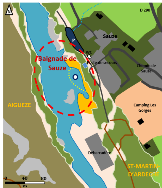
Schéma de la zone de baignade :

⚠ En dehors des horaires de surveillance, la baignade est sous l'entière responsabilité et aux risques et périls des usagers