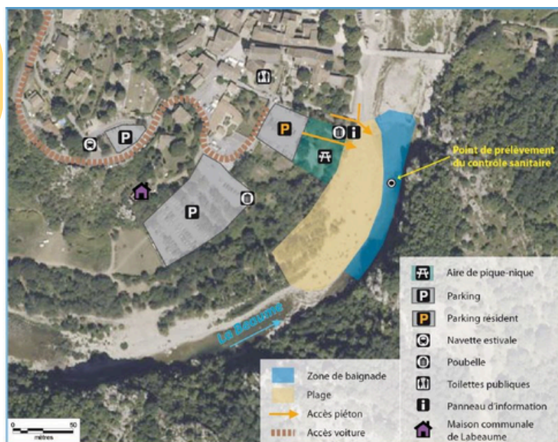
Schéma de la zone de baignade :

1 jour de fermeture pour cause de mauvais résultat