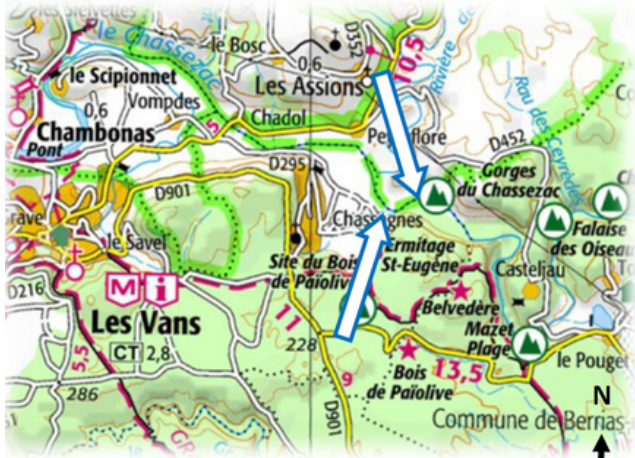
Carte IGN