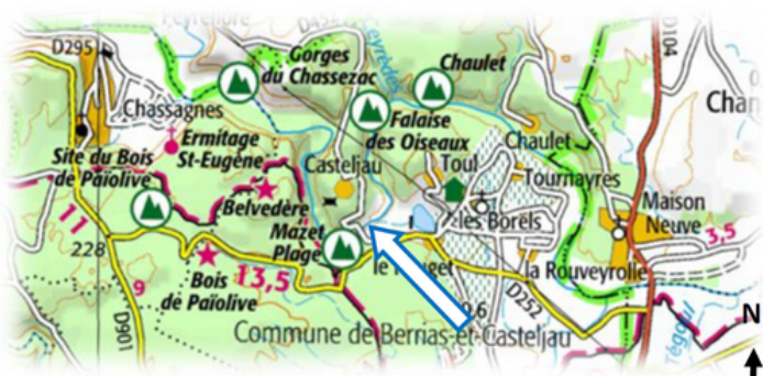
Carte IGN