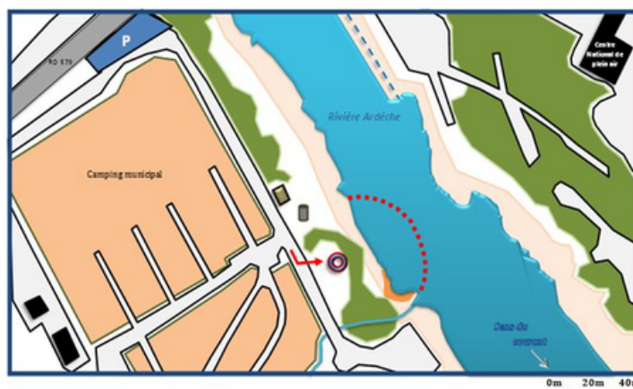
Schéma de la zone de baignade :

Épisodes de pollution au cours de la saison 2025 : aucun jour de fermeture