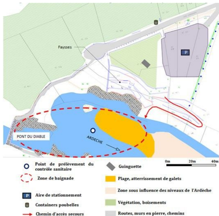
Schéma de la zone de baignade :

Episodes de pollution au cours de la saison 2025 : Aucun dépassement des seuils réglementaires n'a été enregistré durant la saison